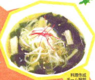
料理作成 チーム服部