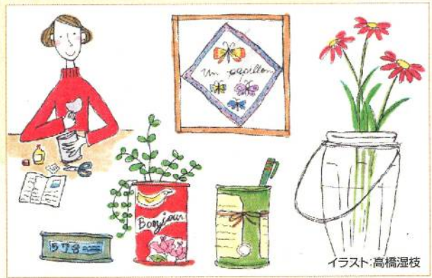
イラスト:高橋温枝

巻き付けてハンドルを付けると表情が豊かになり、吊るして使うこともできます。レース編みのカバーを付けるのもおすすめ。ペン類やカトラリー類などをに入れて“見せる収納”にしたり、花器にも利用できます。 使わなくなったスカーフやハンカチなどは、絵や写真と同じように額縁に入れて飾ると、アート感覚のおしゃれなインテリアとして楽しめます。きれいに飾るコツは、アイロンをかけてシワをきちんと伸ばし、中紙に四隅を貼り付けるなどしてずれないようにするのがポイント。余り布はハンガーカバー、ブックカバーなどに活用したり、貝殻に貼り付けて小物入れにすると良いでしょう。 海辺などで見つかる流木はそれだけでもインテリアのアクセントになりますが、ワイヤーを取り付けて吊るし、いろいろなものをディスプレイするのも素敵です。ぜひ、皆さんも身近なものをリメイクしてインテリアに生かしてみましょう。